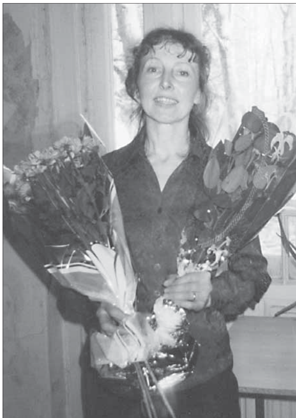
Так она с раннего детства избрала профессию медсестры и отдала 40 лет делу ми-