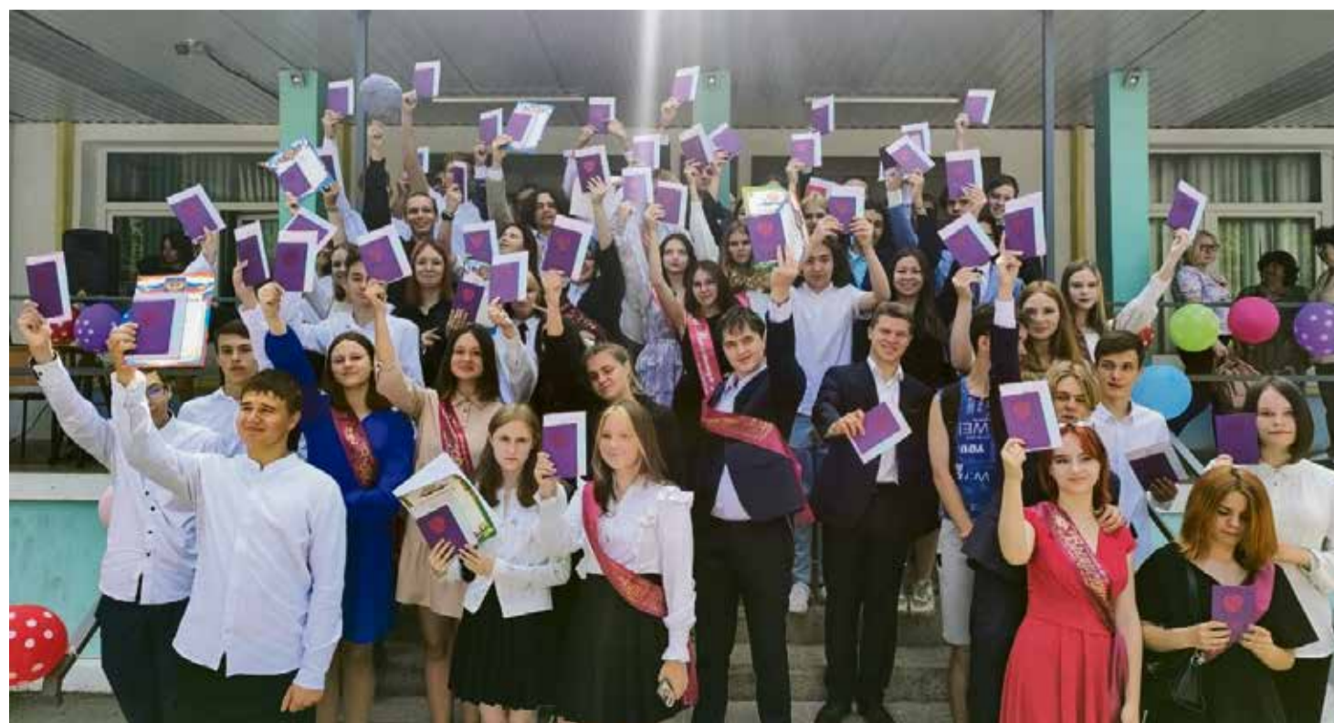
Мы гордимся своими выпускниками