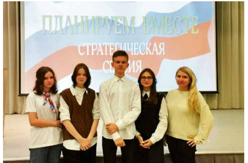
РДШ – дорога в будущее