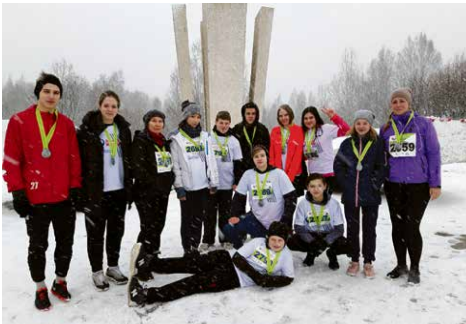
Участники марафона «Дорога жизни»