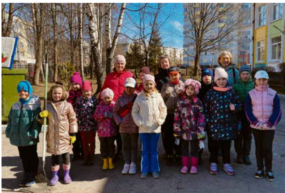
Субботник на школьной территории