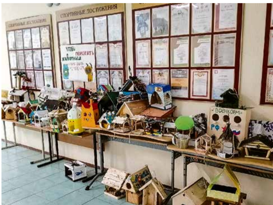
Выставка кормушек для птиц