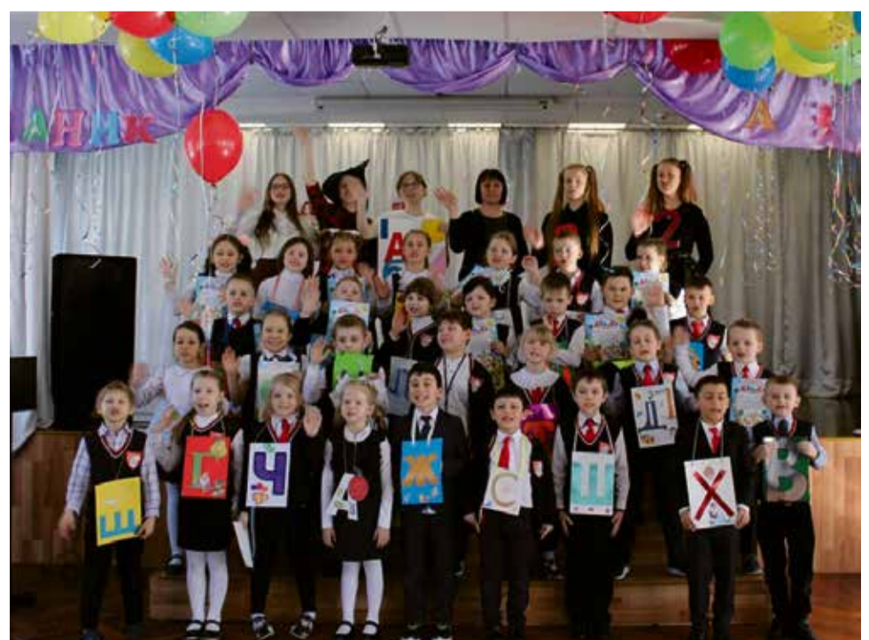
Прощание с азбукой