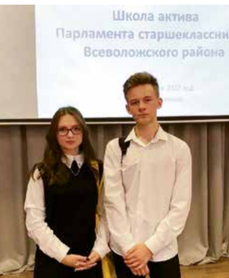
Школьное ученическое самоуправление

Мой новый жизненный виток, связанный со школой, начался с того, что мне предложили занять должность директора школы, в которой я проработала несколько лет. Я стала задаваться вопросами: «Как стать мастером в новой должности и Директором с большой буквы? Как повести за собой коллектив? Как стать для них наставником?».