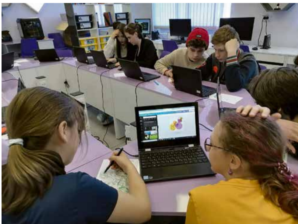
Семинар-практикум "SMM продвижение"