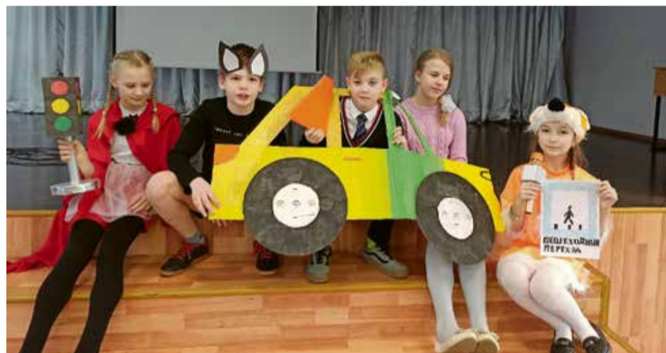
Безопасность на дорогах