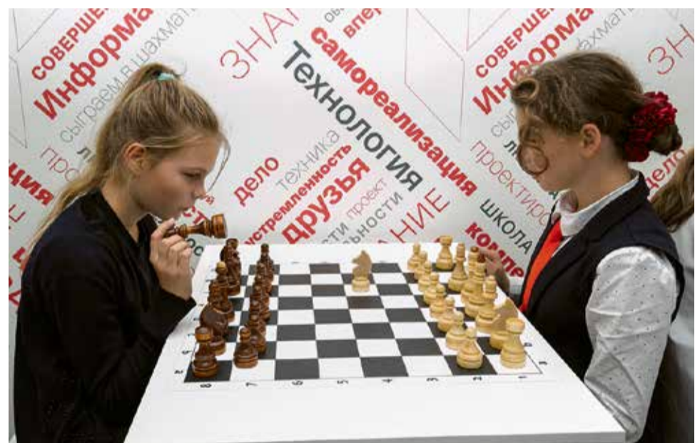
Шахматы в школе