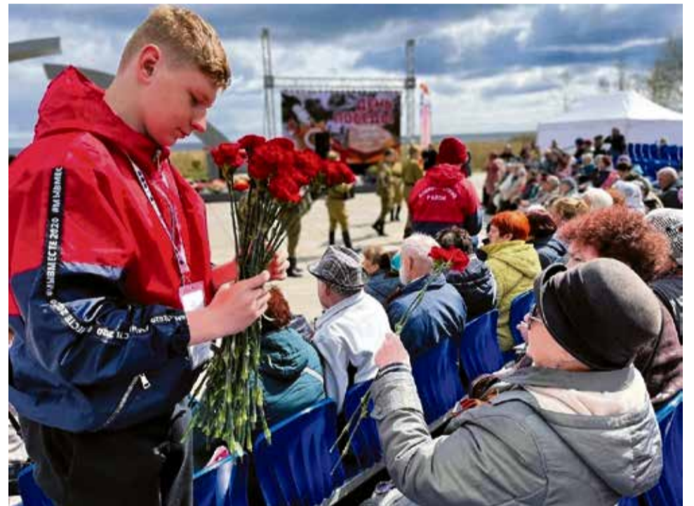
■ Волонтерский отряд «Спектр» поздравляет ветеранов