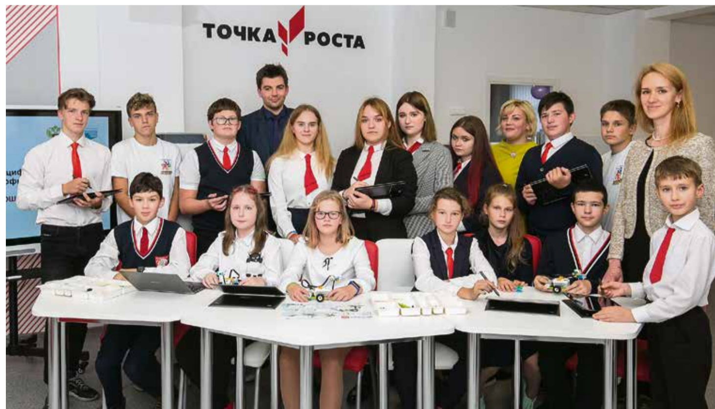
В Центре образования «Точка роста».